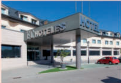
Hotel FC Villalba 4*