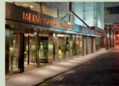
Hotel Meliá Madrid Princesa 5*

https://www.exehotels.com/exe-moncloa.html