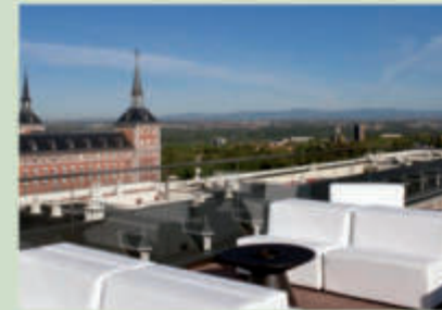
Hotel EXE Moncloa 4*

https://www.exehotels.com/exe-moncloa.html