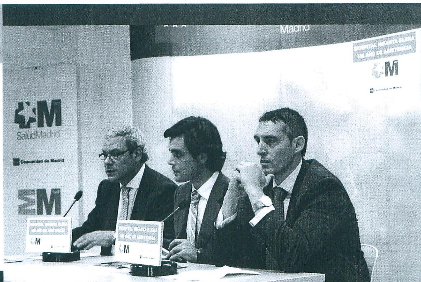
EL ALCALDE DE VALDEMORO, EL CONSEJERO DE SANIDAD Y EL GERENTE DEL HOSPITAL INFANTA ELENA DURANTE EL ACTO DEL PRIMER ANIVERSARIO DE LA INAUGURACIÓN DEL CENTRO HOSPITALARIO.

de calidad y la opinión de los usuarios, que es lo más importante. Lo que revelan es que tienen un nivel de satisfacción por encima del 90 % en todos los parámetros, tanto en los que se refiere a la atención que se recibe en hospitalización, como en urgencias como en las demoras, como en el trato que dispensan los profesionales. Realmente ese más de 90%, que significa un 9 sobre 10, es un sobresaliente, que es la nota que los usuarios del hospital, los vecinos de Valdemoro, de San Martín de la Vega, de Titulcia y de Ciempozuelos, así como de Pinto, asignan al funcionamiento del centro hospitalario.