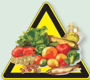
Tomar una dieta completa y equilibrada