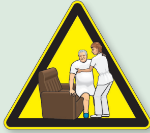
Saber cuidarse para cuidar