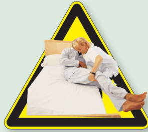
Cama limpia, seca y sin arrugas