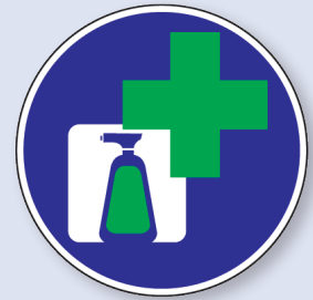
Usar productos especiales para proteger la piel de heces y orina