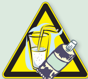
Mantenerse bien hidratado