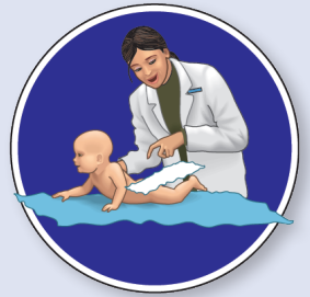
Cambiar el pañal cuando esté mojado