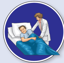
Realizar cambios posturales evitando el arrastre usando la sábana entremetida