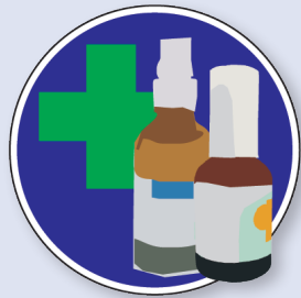
Usar ácidos grasos hiperoxigenados en zonas de apoyo (aceites especiales)