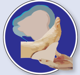
Proteger zonas de apoyo