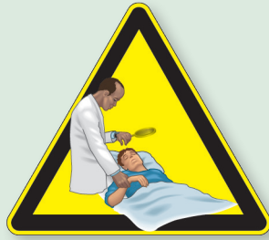
Vigilar zonas de apoyo