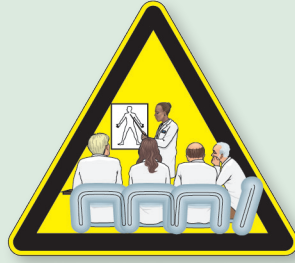
Paciente y cuidador: formados e Informados