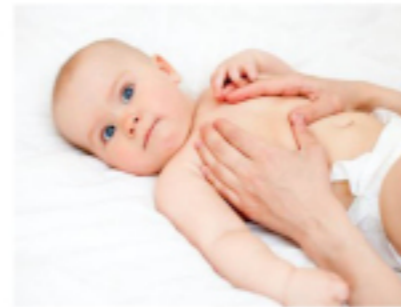
Técnica de vibración manual en bebé.